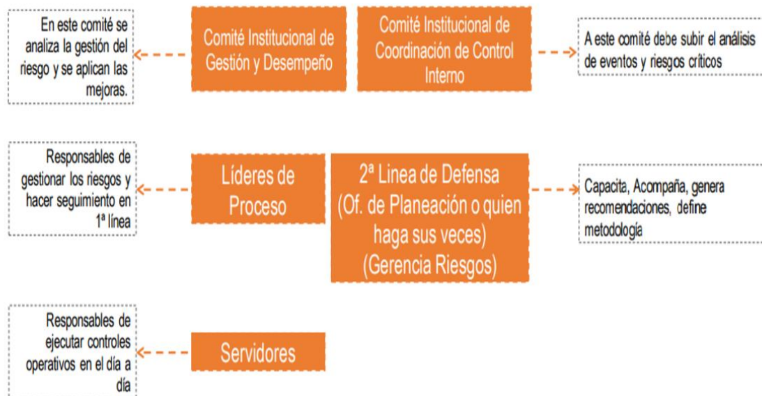
Figura 1. Operatividad Institucionalidad para la Administración del Riesgo